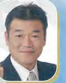
◆愛知県議会議員 横田たかし