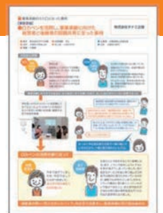
★活用事例はロカベンHPで