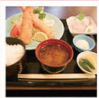
潮幸さんの 刺身付きエビフライ定食