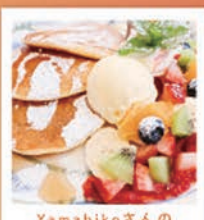
Yamabikoさんの フルーツパンケーキ