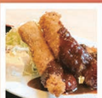
栄五郎寿司さんの 味噌カツ定食