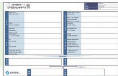
モデルシート(上:財務、下:非財務) →