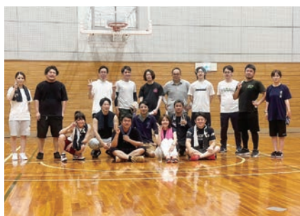
6月に行った部員交流事業 （バスケットボール）

研修事業（セミナー等）、地域振興事業（地域の奉仕活動等）、親睦活動事業等です。詳しくは、商工会までお問い合わせください。