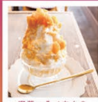
喫茶いそべさんの マンゴーかき氷