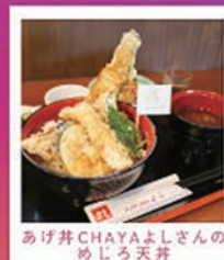
あげ井CHAYAよしさんの めじろ天丼