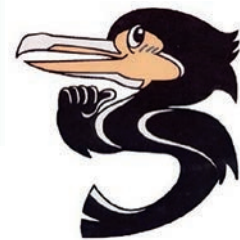
美浜町商工会 キャラクター ウッピー

〒470-2403 愛知県知多郡美浜町大字北方字山鼻48-1 TEL 0569-82-3951 FAX 0569-82-4266 E-mail mihama-s@abelia.ocn.ne.jp URL https://r.goope.jp/srb-23-58