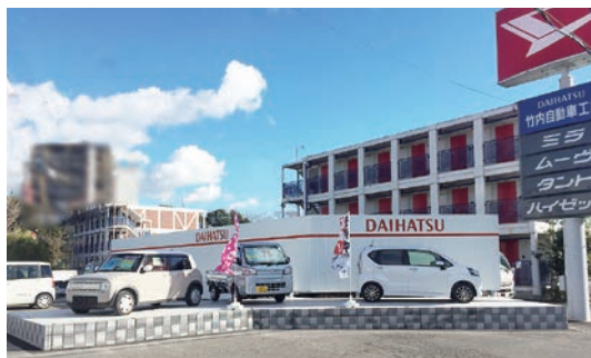
補助金を活用し設置した車の展示場

展示場の設置」や「看板の設置」を積極的にを行い、その際に活用した補助金申請を商工会の支援を受けながら取り組んだ。