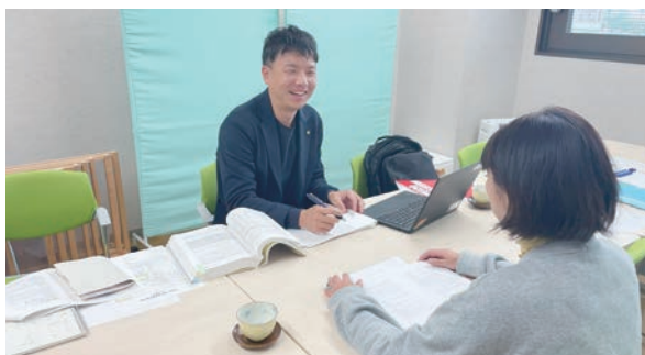
専門家の個別相談

この他にも、商工会が取り組んでいる「人材確保支援事業」の求人チラシ掲載も活用して、人手不足解消に取り組み、従業員の雇用につながった。